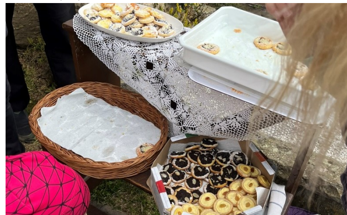
TRADIČNÍ LIBŠÁTSKÁ POUŤ SV. JIŘÍ V LIBŠÁTĚ