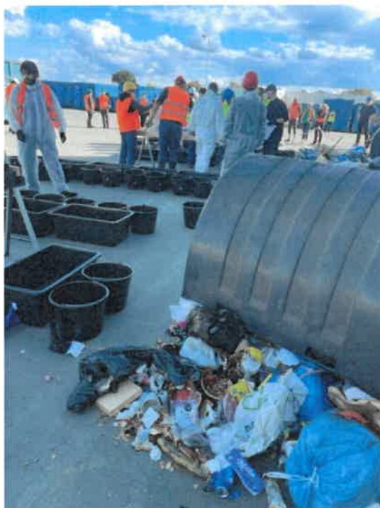
Ilustrační foto č. 4 – provádění rozboru směšného komunálního odpadu