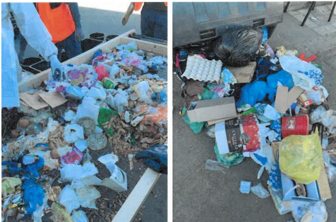
Ilustrační foto č. 3 – směsný komunální odpad vysypaný z popelářského vozu