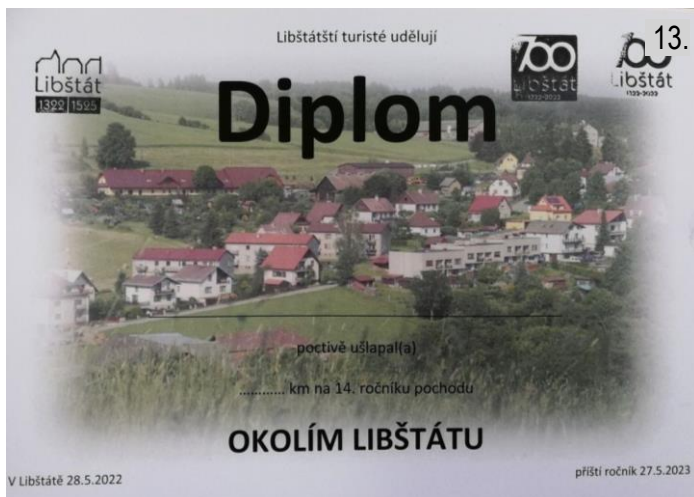
V Libštátě 28.5.2022